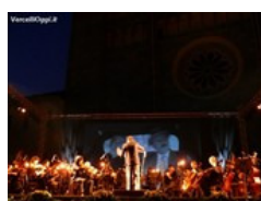
Davanti alla Basilica - Enrico Beruschi racconta Guareschi - Omaggio alle musiche da film di Alessandro Cicognini